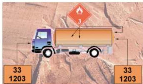
Unidad de transporte (tanque o de carga general) cargada con una única mercancía peligrosa