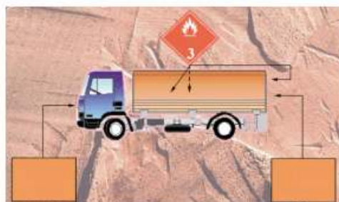
Vehículo de carga general con dos o más mercancías peligrosas de la misma clase o división.