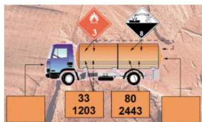
Vehículo cisterna con dos o más mercancías peligrosas de diferentes clases o división.