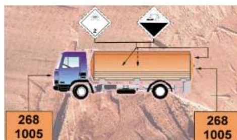
Unidad de transporte (tanque o de carga general) cargada con una única mercancía peligrosa, que exige una etiqueta de riesgo principal y otra de riesgo secundario.