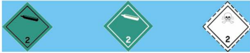
División 2.2 GASES NO INFLAMABLES, NI TOXICOS