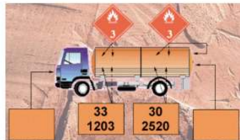
Vehículo cisterna cargado con dos mercancías de la misma clase o división.