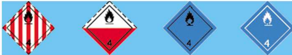
División 4.1 SOLIDOS INFLAMABLES