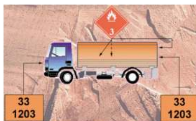
Vehículo de carga general con una mercancía peligrosa en cantidad superior a la excenta y varias no peligrosas (descartadas las incompatibilidades).