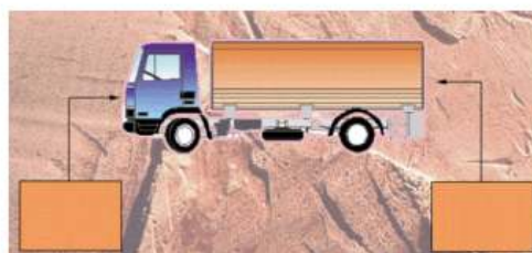
Vehículo de carga general con dos o más mercancías peligrosas de diferentes clases o división.