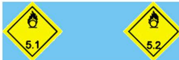
División 5.1 SUSTANCIAS OXIDANTES